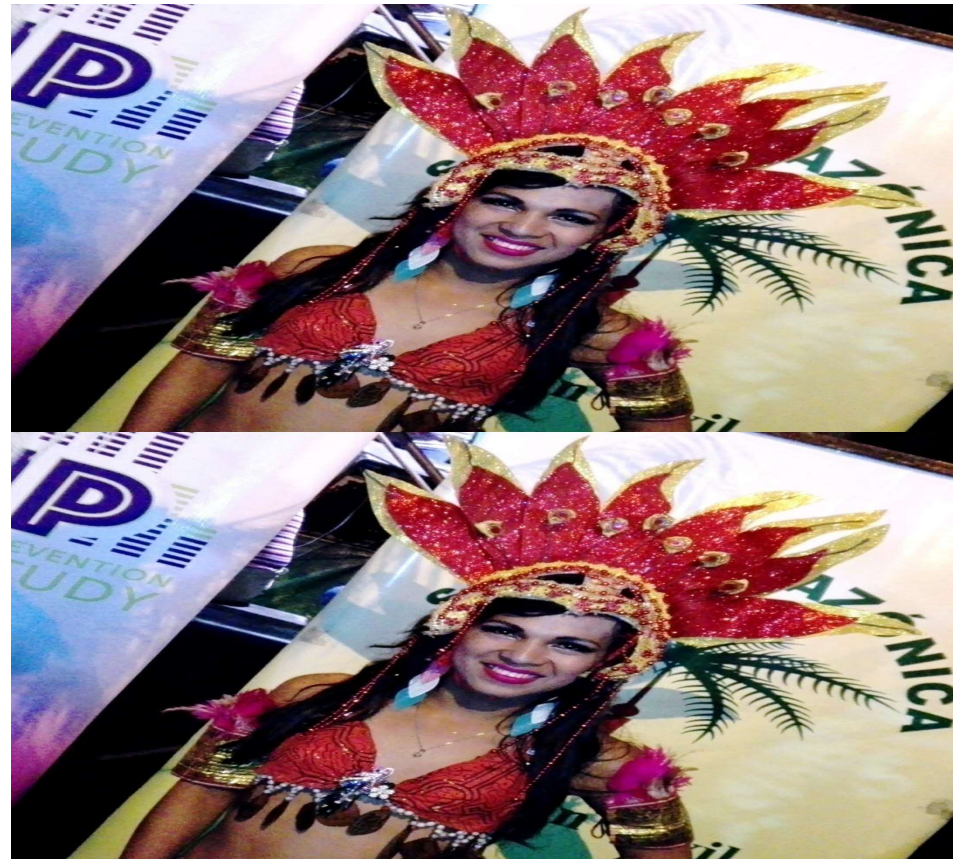
Diosa Trans del Carnaval