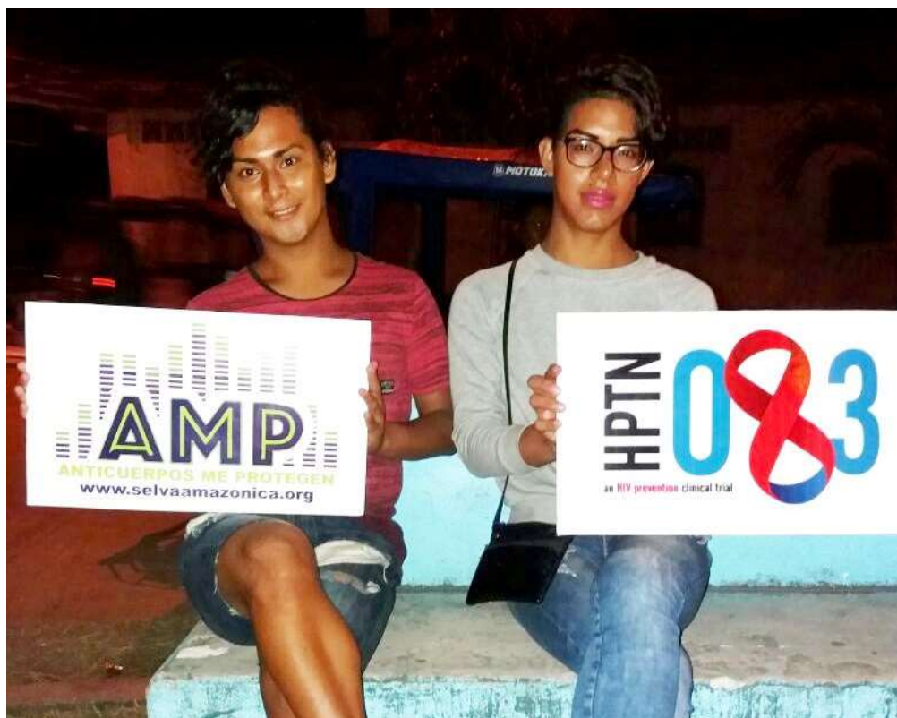
Activaciones en Lozas Deportivas