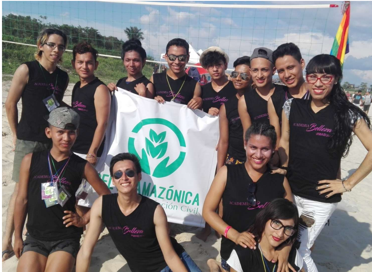
Academia de la Belleza