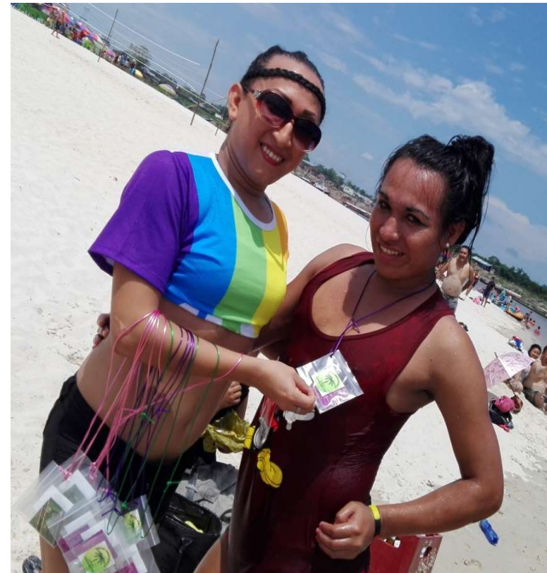
Voley Playa y prevención