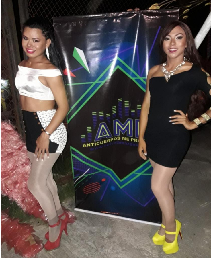
Miss Belen Trans