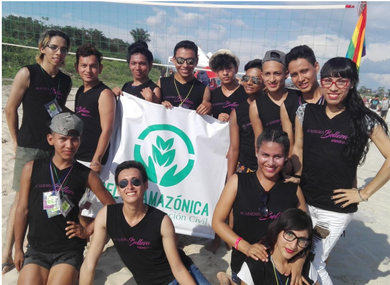
Academia de la Belleza