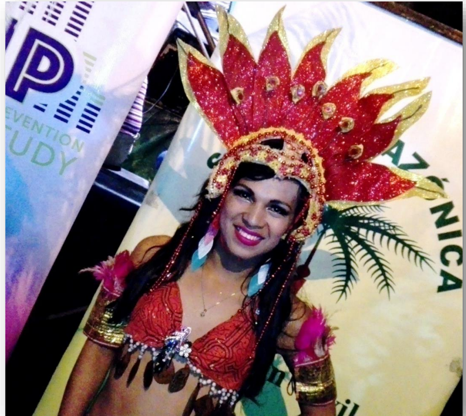
Diosa Trans del Carnaval