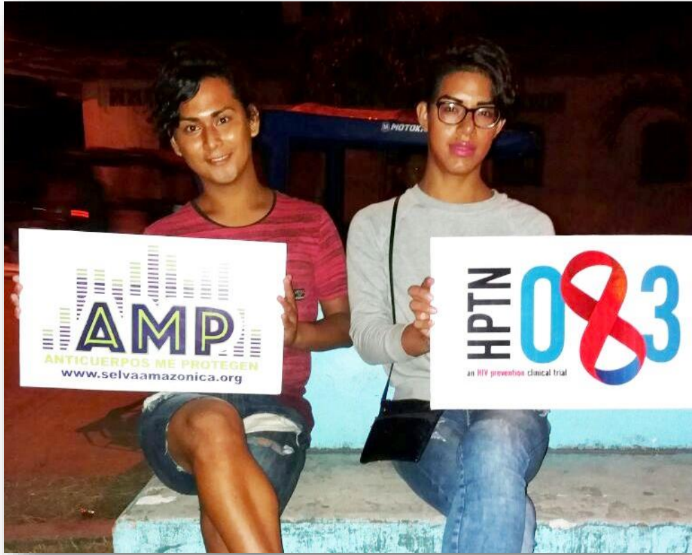
Activaciones en Lozas Deportivas