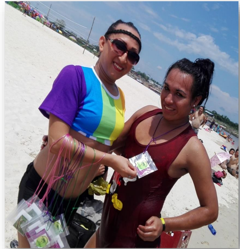
Voley Playa y prevención