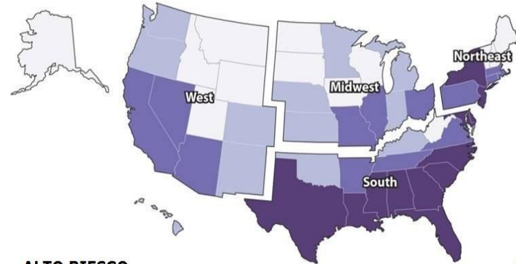
Riesgo de por vida de diagnóstico de VIH por estado